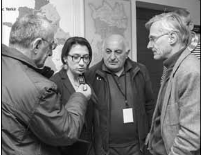
Բելգիայի խորհրդարանի պարզամտներ Սերժ Դեպատուլը (աջից) պարասխանում է «Այունյաց երկիր» հարցերին

Մեր հաջորդ կանգառն Իվանյան (նախկին խոջալու) գյուղն է, որտեղ ընտրատեղամասը տեղակայված էր դարոցում: Այստեղ եւս վարկու-